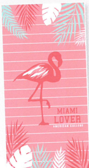
1764 DRAP DE PLAGE FLAMANT ROSE Serviette une face velours imprimé flamant rose, une face bouclettes blanches. 100% coton. 75x150 cm.