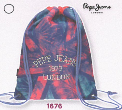
1676 SAC A DOS SOUPLE PEPE JEANS Toile polyester imprimée UK, intérieur doublure avec mini imprimé sur fond rose. Fermé par cordons de serrage qui servent pour le porter sur le dos. 44x35 cm.