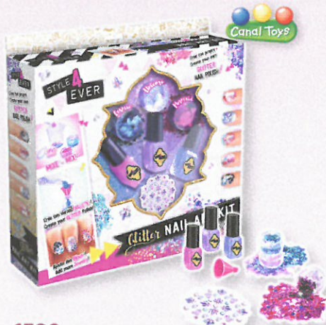
1709 COFFRET MANUCURE PAILLÉTÉE Adopte un style licorne, sirène ou cosmic jusqu'au bout des ongles et décore-les au gré de tes envies avec stickers, strass et paillettes. Inclus : 3 vernis, 3 pots de paillettes, 1 pinceau et plus de 60 stickers.