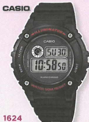
1624 MONTRE CASIO ILLUMINATOR Affichage LCD avec éclairage LED. Fonction chrono. Alarme quotidienne. Calendrier automatique. Boîtier diam. 4 cm et bracelet résine. Étanche 50 m.