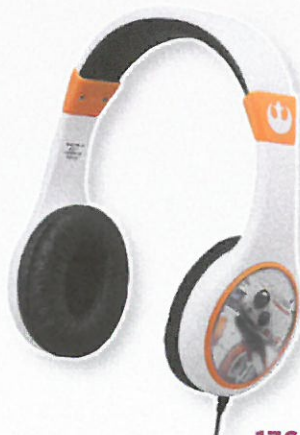
1768 CASQUE STAR WARS Casque filaire spécialement adapté aux plus jeunes grâce au système de limitation du volume sonore. Prise jack 3,5 mm.