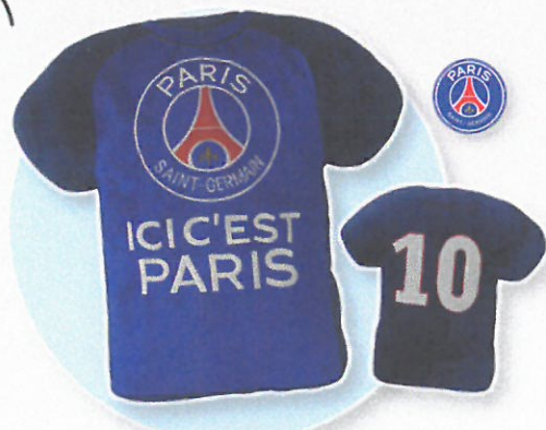
1783 COUSSIN MAILLOT PSG Coussin réalisé en 100% polyester, garnissage 100% polyester. 2 faces décorées : logo PSG et numéro 10 de l'autre côté, comme un vrai T-shirt de footballer. Dim. 36x40 cm (au niveau des bras). Lavable 30°.