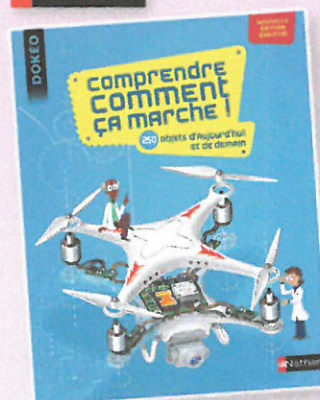
1651 COMPRENDRE COMMENT ÇA MARCHE ! Pour percer les secrets des objets qui nous entourent ! 4 grandes parties pour décortiquer et décrypter le fonctionnement des objets : à la maison, à notre service, pour nos loisirs et dans les transports. Un livre très visuel, dont les dessins dévoilent la technique et explicitent les nouvelles technologies ! 167 pages.