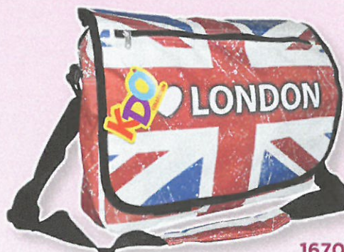
1670 BESACE A RABAT UK Polyester imprimé UK. Grand compartiment zippé sous rabat fermé par scratch, poche plaquée zippée intérieure. Poche plaquée à l'avant sous le rabat. Rabat incluant une poche zippée. Bandoulière réglable. 40x30x5 cm.