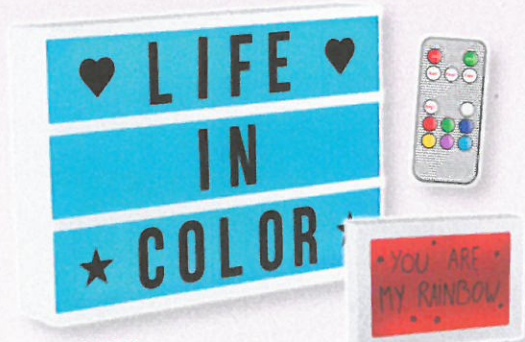
1718 BOITE LUMINEUSE A MESSAGES RECTO-VERSO Côté recto disposez les lettres et les symboles, côté verso écrivez et dessinez ! Éclairage LED multicolore. Livrée avec 1 feutre effaçable, télécommande, 76 lettres et 9 symboles. Grâce à la télécommande, sélectionnez la couleur et le mode d'éclairage souhaité (fixe ou clignotant). Alim. 3 piles LR6 non fournies ou câble USB inclus. 29,7x20,9x5,3 cm.